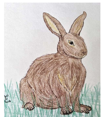
Malgruppe Art 55plus; Künstlerin: Inge