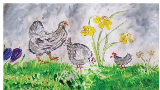
Malgruppe Art 55plus; Künstlerin: Hildegard