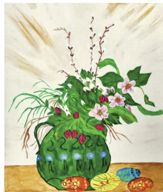
Malgruppe Art 55plus; Künstlerin: Inge