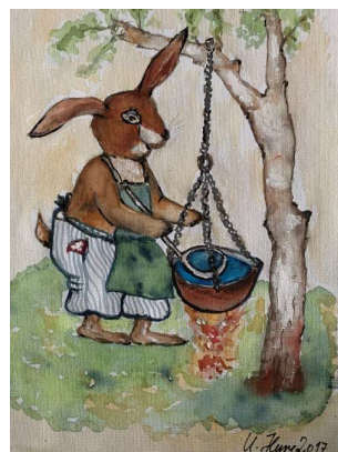
Künstlerin: Uschi Hune

Die Malgruppe „Art 55plus“ und Andere haben für die Osterausgabe wieder ein paar schöne Oster- und Frühlingsbilder geschaffen, die wir Euch nicht vorenthalten wollen. Sie sind in der folgenden Galerie dargestellt: