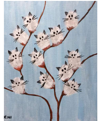
Malgruppe Art 55plus - Künstlerin: Edith