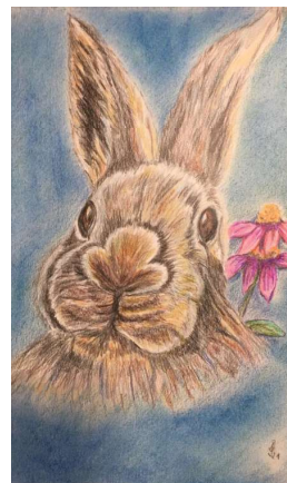
Malgruppe Art 55plus; Künstlerin: Inge