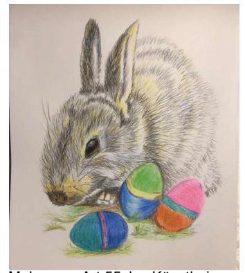
Malgruppe Art 55plus Künstlerin: Regina